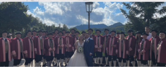
Hochzeit Hotel Dollenberg